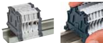
Tope final 0 375 10 montaje sin tornillos