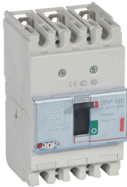
DPX3 160 LEGRAND

Int. Termomagnético DPX 3 160 3P, reg. de 50.4A a 63A. 36kA/380-415 Vac