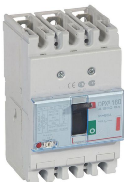
DPX3 160 LEGRAND

Int. Termomagnético DPX 3 160 3P, reg. de 64A a 80A. 36kA/380-415 Vac