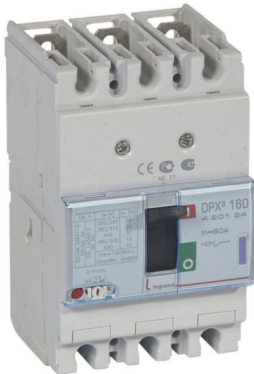
DPX3 160 LEGRAND

Int. Termomagnético DPX 3 160 3P, reg. de 64A a 80A. 50kA/380-415 Vac